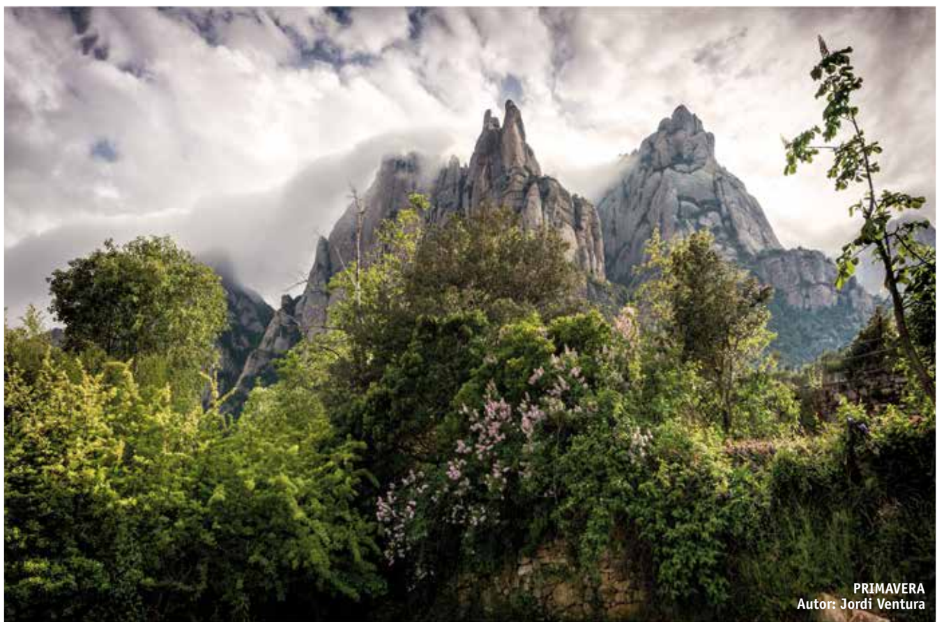
PRIMAVERA Autor: Jordi Ventura