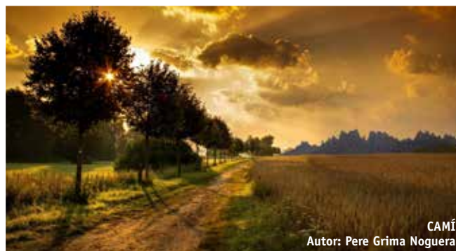
CAMÍ Autor: Pere Grima Noguera