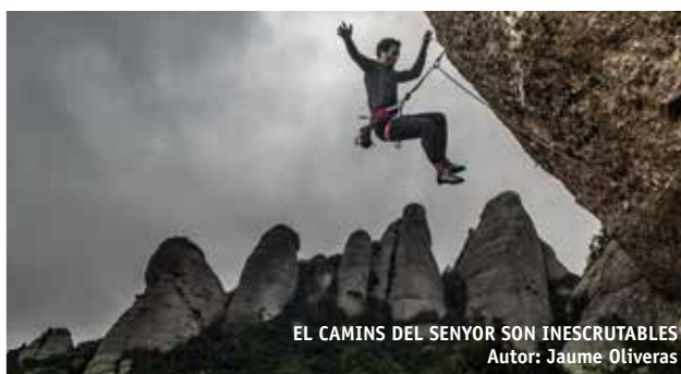
EL CAMINS DEL SENYOR SON INESCRUTABLES Autor: Jaume Oliveras