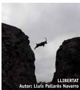
LLIBERTAT Autor: Lluís Pallarès Navarro