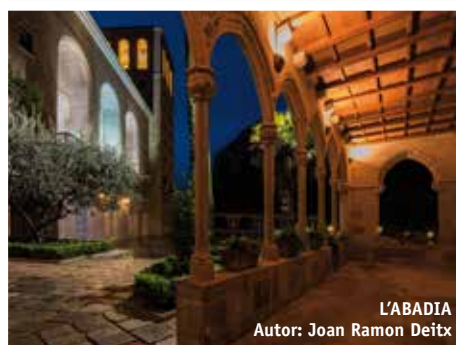
L'ABADIA Autor: Joan Ramon Deïtx