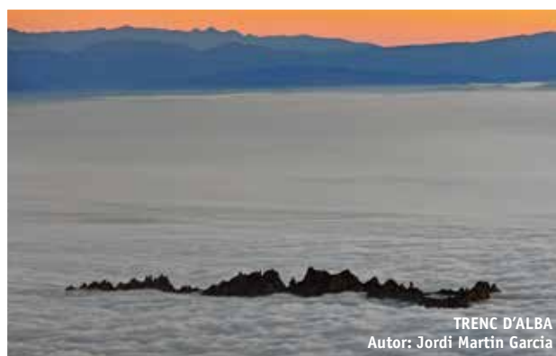
TRENC D'ALBA Autor: Jordi Martín García