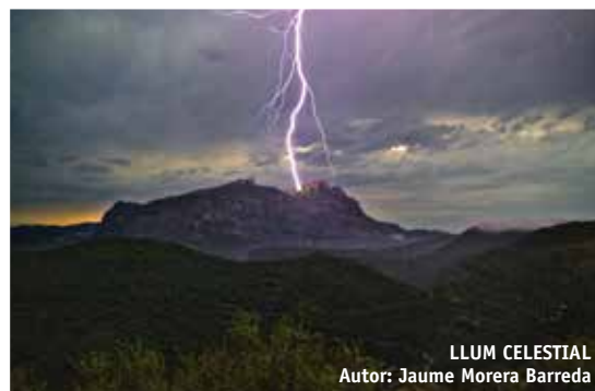
LLUM CELESTIAL Autor: Jaume Morera Barreda