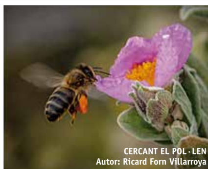
CERCANT EL POL - LEN Autor: Ricard Forn Villarroya