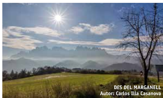
DES DEL MARGANELL Autor: Carlos Illa Casanova